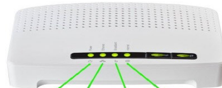
Power Ethernet Broadband Internet