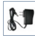
Adaptateur de courant