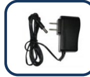
Adaptateur de courant